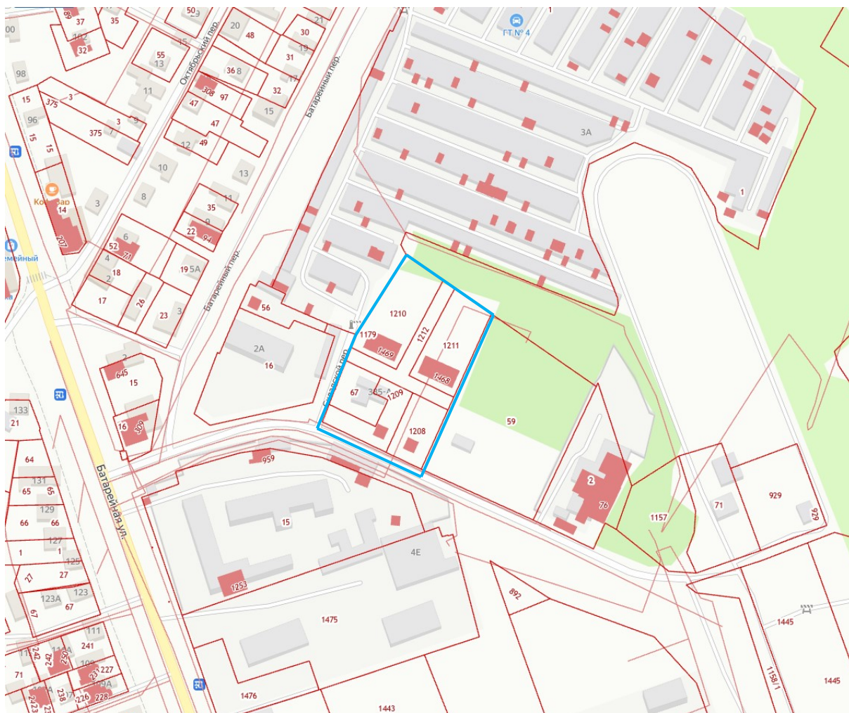
Схема границ проектирования