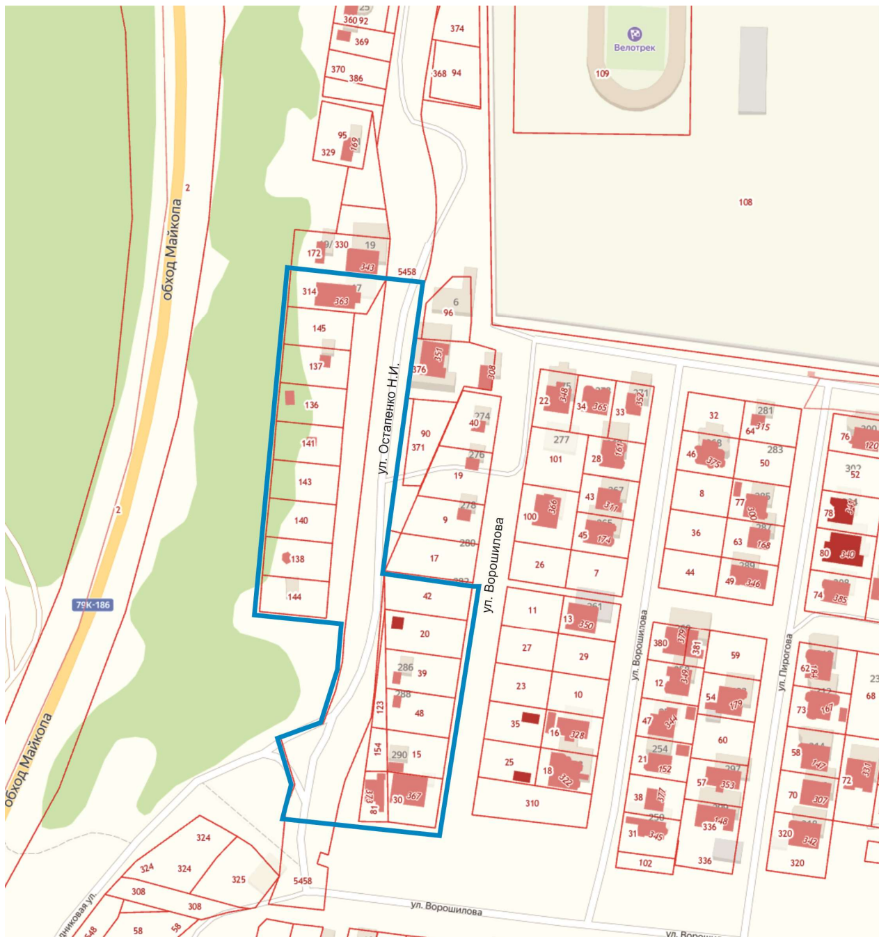
Схема границ проектирования