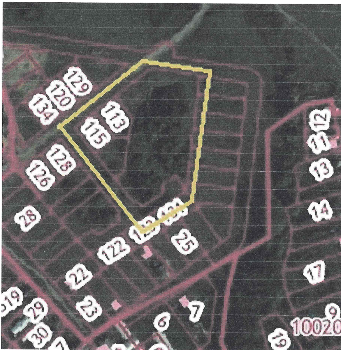
Схема границ проектирования